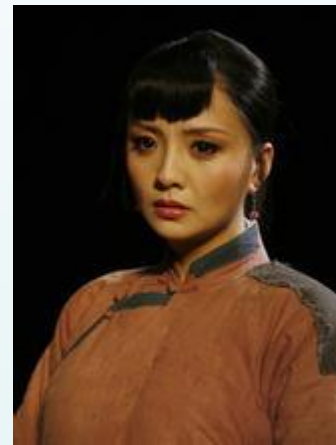
一步步走向毁灭的 小福子

离死亡只差一步的老马和小马祖孙俩，还有抢车的大兵、不给仆人饭吃的杨太太、诈骗祥子的孙侦探等，展示了一幅具有老北京风情的事态图。