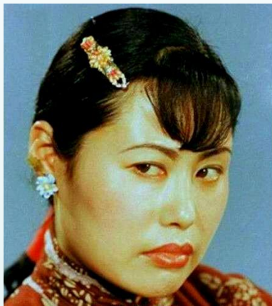
大胆泼辣又有点 变态的虎妞