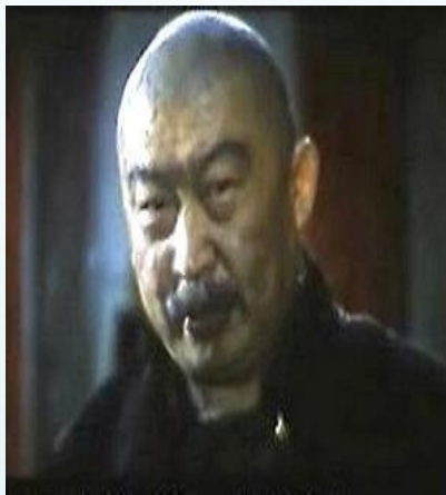
残忍霸道的 车主刘四爷